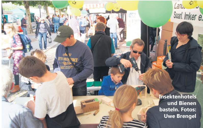
Insektenhotels und Bienen basteln.

te sich die emsigen Tierchen auch im Rahmen des Cittaslow-Marktes einmal in natura anschauen. Unter fachkundiger Anleitung durften die Kinder gleich nebenan ein Insektenhotel bauen und mit nach Hause nehmen oder bei der Stadtjugendpflege kleine Bienen aus Styropor und Pappe basteln. Eine hübsche Deko-Idee für das Kinderzimmer. Gerne wurde auch das Schminke-Angebot genutzt. Somit waren die Gemeinschaftsstände von Imkerbund und Stadtjugendpflege zwei der kreativsten Anlaufstellen dieser Veranstaltung.